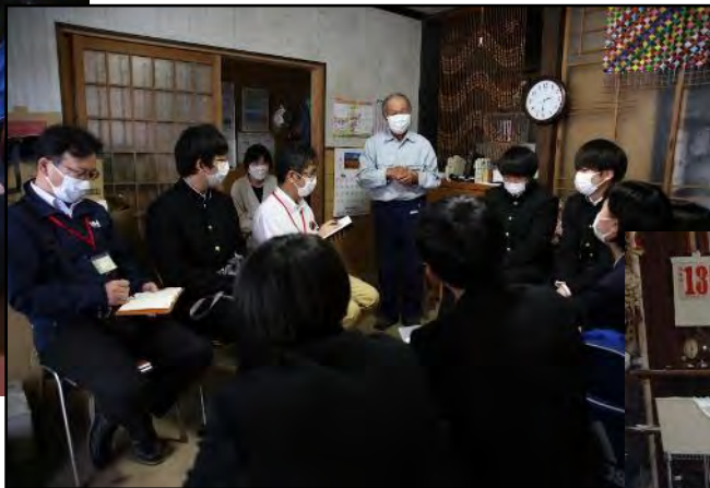
2年次：提案型インターンシップ