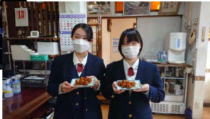
3年次：PBL・活動の総まとめ