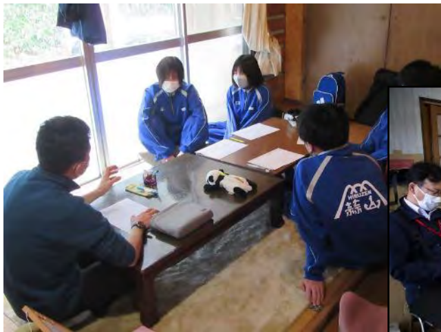
1年次：地元事業所で インターンシップ