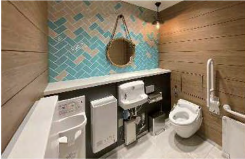
商業ゾーン ALL GENDERトイレ

2ヶ所ある広めの個室のうち1ヶ所は、お子様連れに配慮してベビーチェアとベビーシートを備えた個室を設置。多機能トイレの機能分散を図っている。