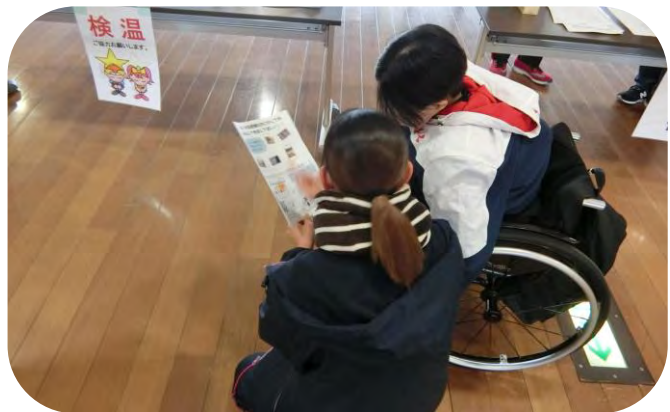
障害者スポーツ教室で右のチラシを説明する図