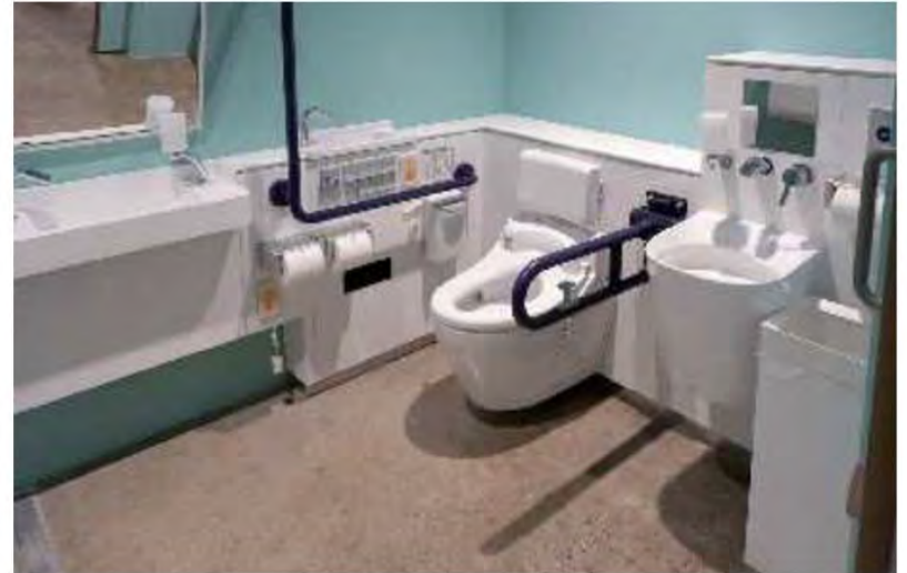
北館2F オールジェンダートイレ バリアフリートイレ

2ヶ所ある広めの個室のうち1ヶ所は、お子様連れに配慮してベビーチェアとベビーシートを備えた個室を設置。多機能トイレの機能分散を図っている。